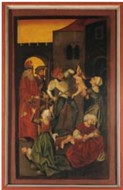
Bethlehemitischer Kindermord, Tafel im Altarraum

Die bemalte Rückseite des Schreines , die ehemals die Werktagsseiten im geschlossenen Zustand des Altares repräsentierten, zeigen die Himmelfahrt der Maria Magdalena, darunter das Martyrium des hl. Sebastian; auf dem anderen Flügel oben die Ursulallegende (mit ihren Gefährtinnen im Schiff) und darunter das Martyrium der Zehntausend.