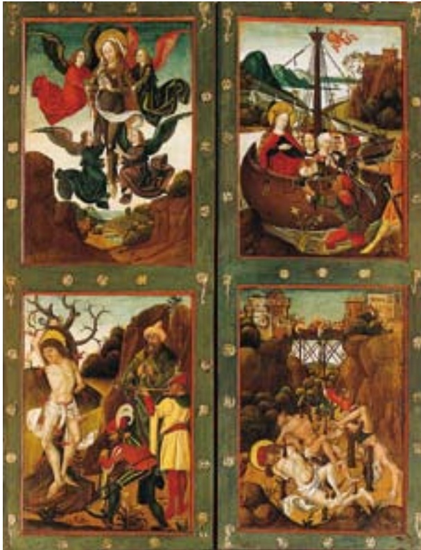
Der gotische Flügelaltar mit geöffneten Flügeln ▷

Zu den Halbreiefs des Flügelaltars finden sich die nächsten Verwandten gleichfalls im Stift Nonnberg: das Martyrium der hl. Afra und jenes der hl. Agnes.