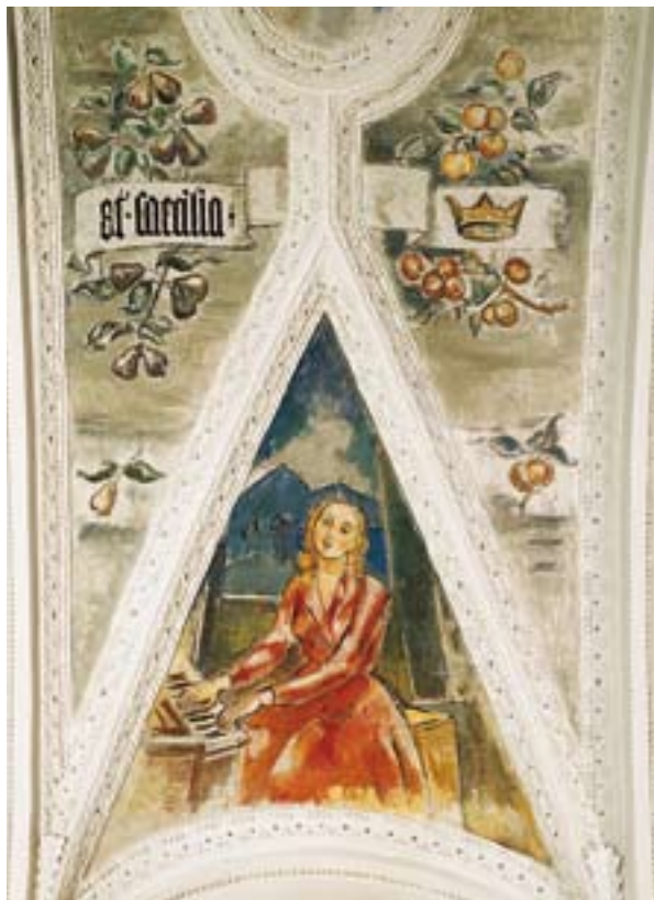
Anton Faistauer, Hl. Cäcilia (15) im Langhaus

gegen den Widerstand der geistlichen Behörde, 1922/23 die Deckenmalereien der Morzger Kirche realisiert zu haben. Er konnte den 1887 in St. Martin/Lofer geborenen ANTON FAISTAUER gewinnen, den Zyklus des Marienlebens in Seccotechnik zu malen. In der ungemein dichten Aussage seiner Bilder ist die Macht der Farbe stets das vorherrschende Mittel seiner Kunst. Wie kein anderer Maler dieser Generation gelang es ihm, die bedeutenden Anregungen der französischen Malerei des 19. Jahrhunderts in seinen persönlichen Stil zu übersetzen.