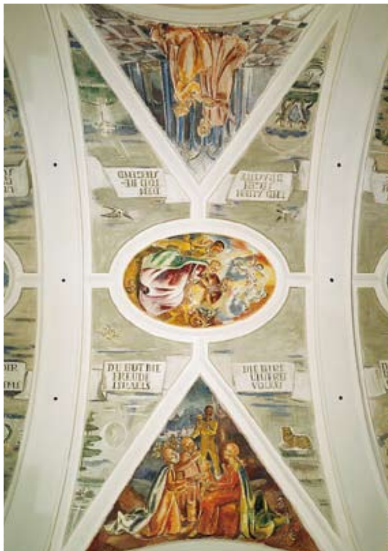
Anton Faistauer, Geburt Christi (4), Darstellung im Tempel (7) und Hll. Drei Könige (17) im Langhaus