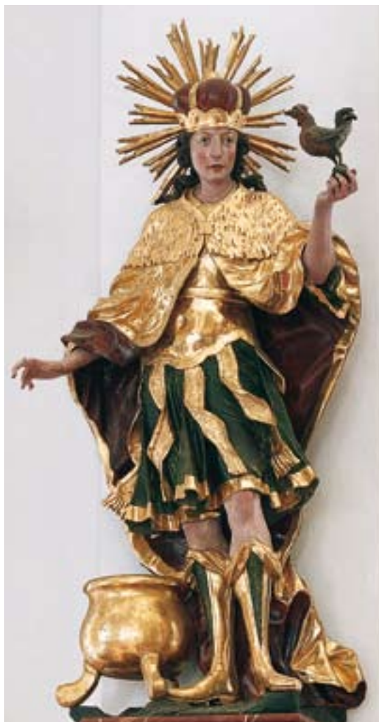
Statue des hl. Vitus, um 1750

Die beiden Figuren neben dem Kircheneingang (Wolfgang mit Kirche und Hacke sowie Leonhard) stammen aus der Mitte des 17. Jahrhunderts.