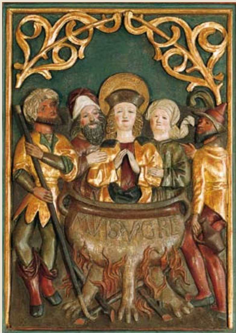
Salzburg / Morzg